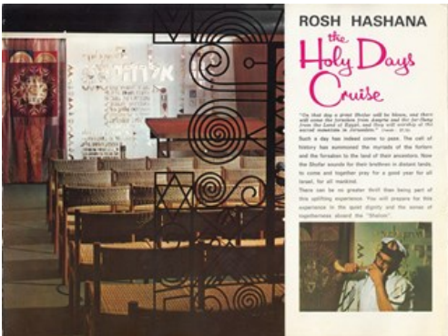
ראש השנה על סיפון האונייה

כגון קרע (דלעת) - שתקרע רוע גזר דינו, ויקראו לפניך זכויותנו; כרתי (כרשה) - שיכרתו שונאנו; תמרים – שיתמו שונאנו ואויבנו; חביא (תלתן) -