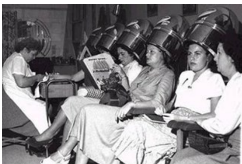
מספרת נשים ברחוב שינקין בתל אביב הגס פין, אוסף התצלומים הלאומי - קוד תמונה D362-073

בשנות התשעים, בעקבות פריצתה של מהפכת התקשורת בישראל, גדלה בצורה דרמטית המגמה לייבא מודלים התנהגותיים מחו"ל. תסרוקות